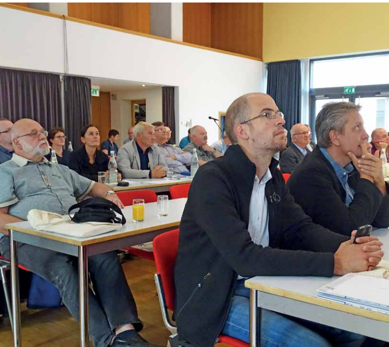
... und das Publikum staunte ...

Phishingmails gefolgt von Internetseiten sind übrigens nach wie vor das Haupteinfallstor für Hackerangriffe. Deshalb sollten unbedingt beide Geräte regelmäßig über einen Virens scanner verfügen.