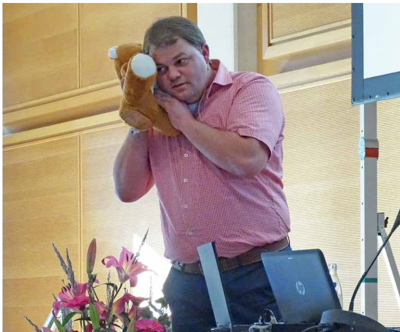
... denn selbst in einem Teddy können böse Überraschungen schlummern.

Wer das weiß, kann sich allerdings auch sehr einfach schützen und die Karten in Alufolie einwickeln. Im Handel werden außerdem Kartenhüllen und komplette Etuis angeboten, die vor dem Datendiebstahl, der sogar aus geschlossener Handtasche funktioniert, schützen. ■