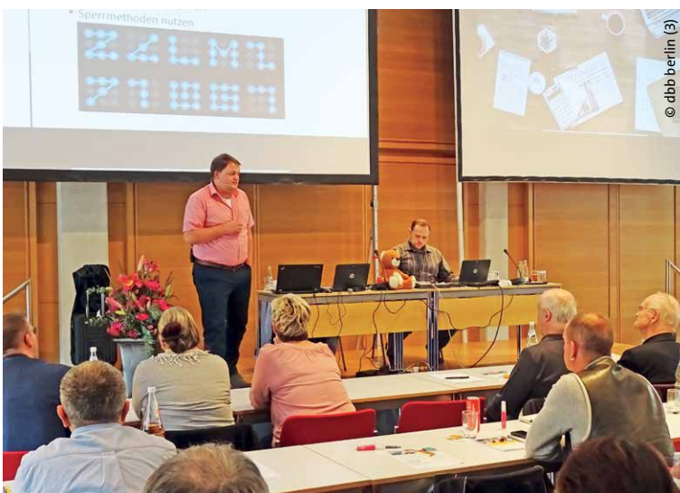
Die beiden „Hacker“ in Aktion ...

Wer sich etwa von dem freundlichen Herrn in der Bahn über Nachrichten an seinem PC aushorchen lässt, darf sich später nicht wundern, seine Informationen in einer überraschend echt wirkenden Phishingmail wiederzufinden. Eine einfache Sichtschutzfolie für den PC und weniger Vertrauensseligkeit seines Benutzers täten hier gute Dienste. Besonders leichtsinnige Zeitgenossen sollen ja sogar PC und Handy ungeschützt liegen lassen, wenn sie sich im Speisewagen einen Kaffee holen.