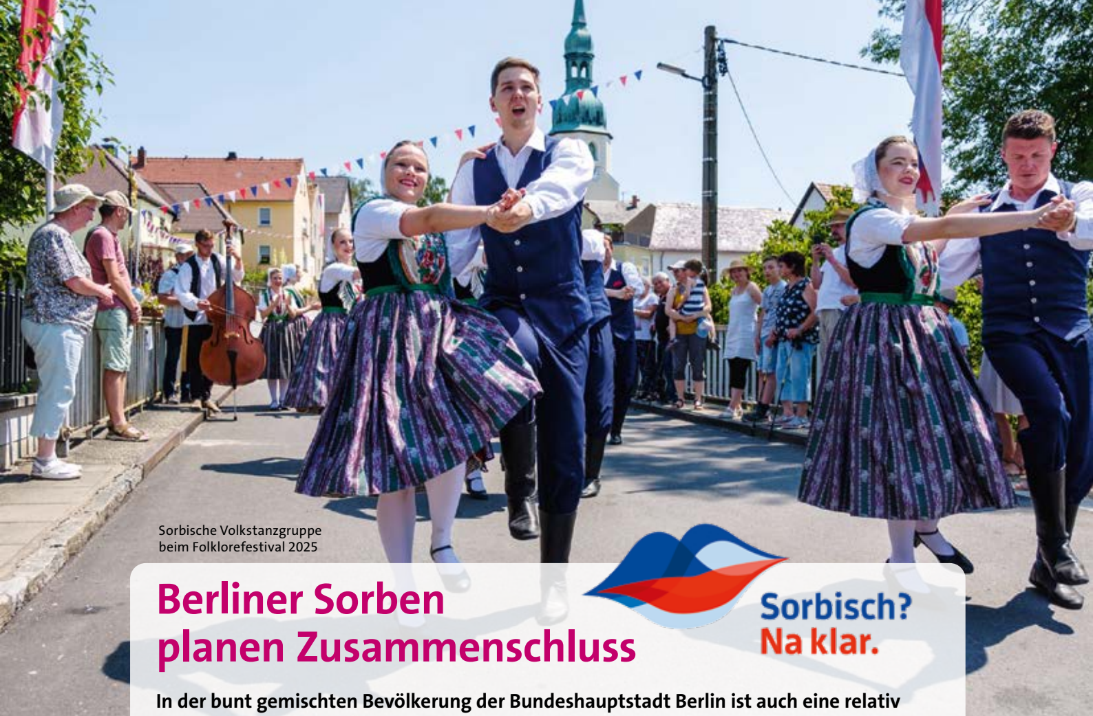
Sorbische Volkstanzgruppe beim Folklorefestival 2025