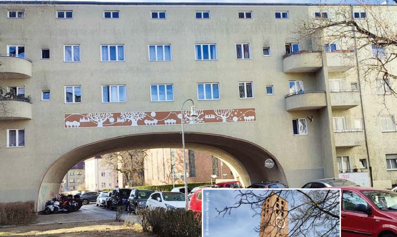
Eingang zu einer Werks-siedlung