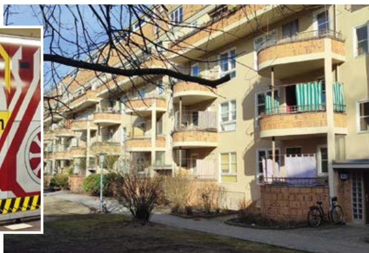
Typischer Wohnblock in der Großsiedlung Siemensstadt